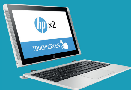
Tablette HP X2