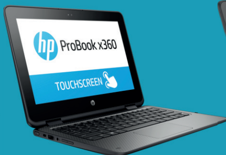
Ordinateur HP X360