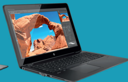
Ordinateur HP Zbook